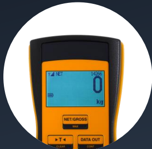
Großes Display an Fernbedienung