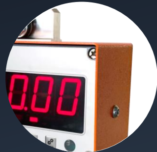
Robuste Schutzhaube & LED-Display