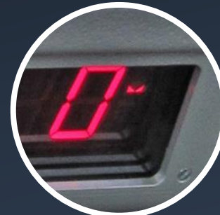
50mm großes und beleuchtetes Display